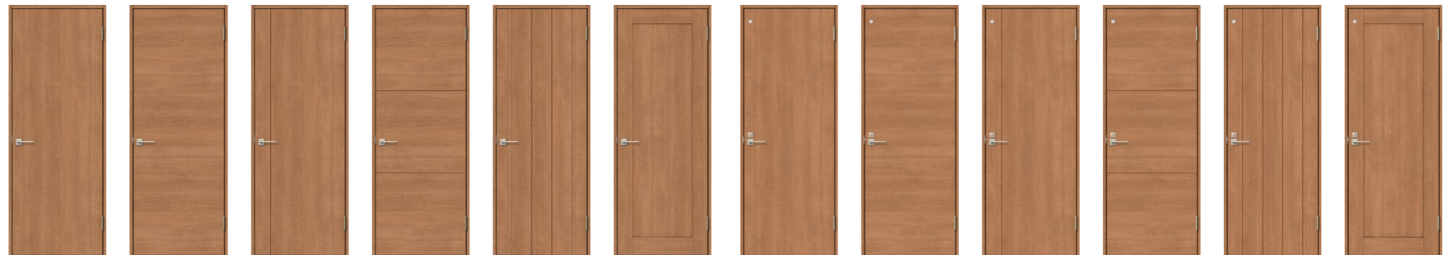
LAA タテ木目 LAB ヨコ木目 LAC LAD LAE LAG LAA タテ木目 LAB ヨコ木目 LAC LAD LAE LAG