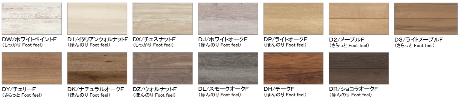
DW/ホワイトペイントF (しっかり Foot feel) D1/イタリアンウォルナットF (ほんのり Foot feel) DX/チェスナットF (しっかり Foot feel) DJ/ホワイトオークF (ほんのり Foot feel) DP/ライトオークF (ほんのり Foot feel) D2/メープルF (さらっと Foot feel) D3/ライトメープルF (さらっと Foot feel) DY/チェリーF (さらっと Foot feel) DK/ナチュラルオークF (ほんのり Foot feel) DZ/ウォルナットF (ほんのり Foot feel) DL/スモークオークF (ほんのり Foot feel) DH/チークF (ほんのり Foot feel) DR/ショコラオークF (ほんのり Foot feel)