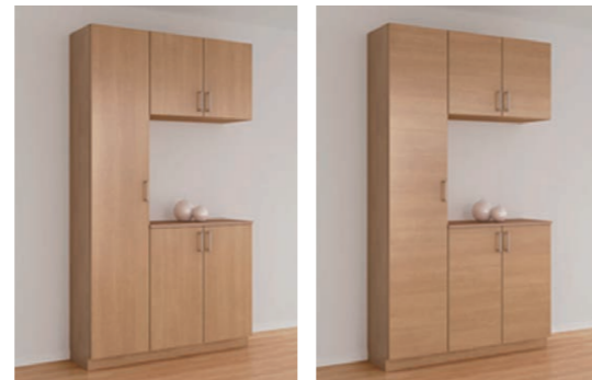
LAA タテ木目 LAB ヨコ木目