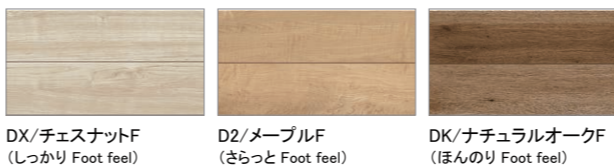
DX/チェスナットF (しっかり Foot feel) D2/メープルF (さらっと Foot feel) DK/ナチュラルオークF (ほんのり Foot feel)