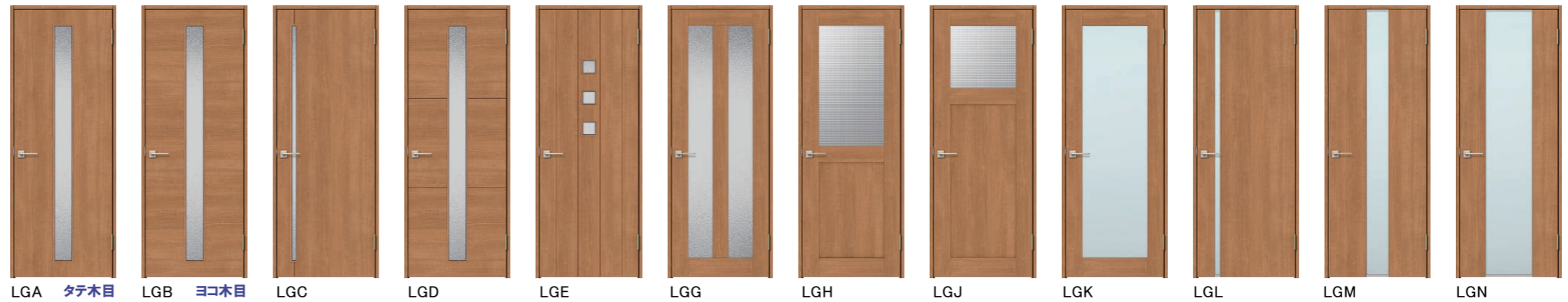
LGA タテ木目 LGB ヨコ木目 LGC LGD LGE LGG LGH LGJ LGK LGL LGM LGN