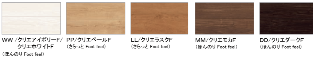
WW/クリエアイボリーF/クリエホワイトF (ほんのり Foot feel) PP/クリエペールF (さらっと Foot feel) LL/クリエラスクF (さらっと Foot feel) MM/クリエモカF (ほんのり Foot feel) DD/クリエダークF (ほんのり Foot feel)